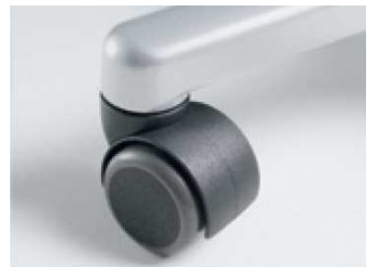
Fußkreuz mit orientierbaren Doppelrollen

Auf Wunsch Rückenlehne mit 2 Beschriftungsfeldern zur individuellen Kennzeichnung