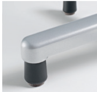
Fußkreuz mit Kunststoffgleiter und Filz-Bodenschoner

Rückenlehne mit ergonomischen Griffloch unten, der Schüler kann, ohne Anstrengung, mit ausgestrecktem Arm den Stuhl tragen- bzw. bewegen.